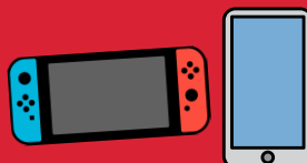
Jeux électroniques et téléphones