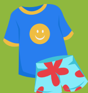
Vêtements de rechange (au besoin)