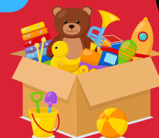
Jouets de la maison