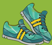
Souliers de course fermés