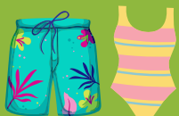
Maillot de bain