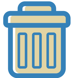
Jetez vos mouchoirs