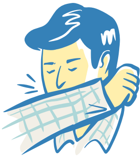
Toussez dans votre coude